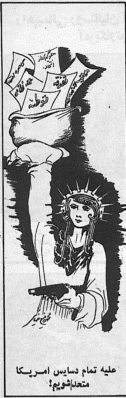
علیه تمام دسایین امریکا متحد شویم!