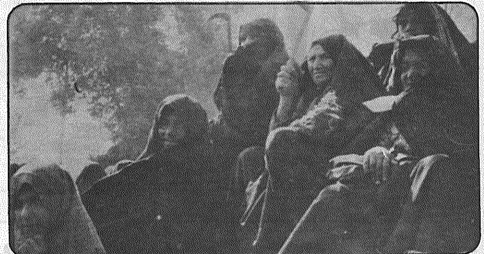
زنان و دختران مبارز و قهرمان میهمان حاضرند در تمام جبهه‌ها علیه صدام جنایتکار و اربابش شیطان بزرگ، بر زمین. زنان دهقان داس در دست دارند. این تفنگ پر قدرت آنهاست.