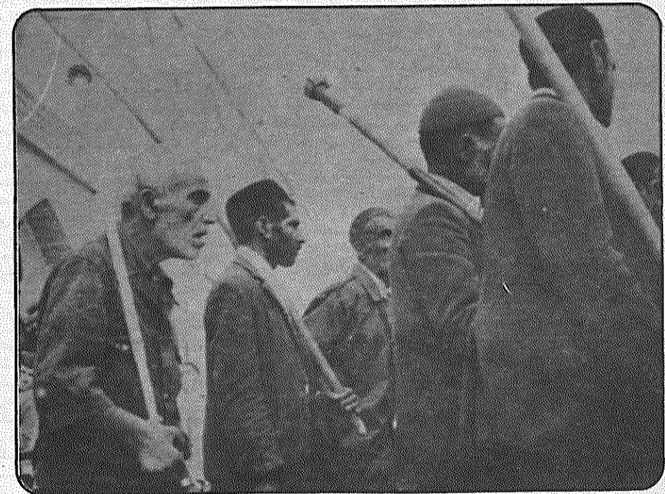
حتی سالخورده‌ترین دهقان نیز به صف راهپیمایان علیه تجاوز آمریکا آمده است. بیله‌ها و شنکشها و داسهای دهقانان نیز سلاح پرای زحمتکشان روستائی ما در مقابله با توطئه‌های آمریکاست. (آبان ۱۳۵۹)