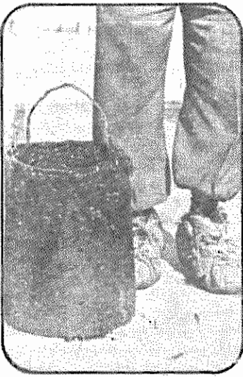
کافیست که سطل قیر داغ «نامهربانی» کند، تا پاهایش به جزغاله‌ای تبدیل شوند.

زین و فرزند و پدر و مادرم آن را خرج می‌کنیم. سپس دوباره عازم تهران می‌شوم. اگر در ده کار باشد و روزی پنجاه تومان به من بدهند، همان‌جا می‌مانم." این کارگران عموماً از دولت می‌خواهند که قطعه زمینی در اختیار آنان قرار داده شود، تا روی آن کشت کنند و در ضمن نرد خانواده خود باشند. همچنین دولت باید وسایل کشاورزی و بذرها را در اختیار آنان بگذارد. اگر در حالت گرسنگی برای دولت این امکان وجود ندارد، لاقبل باید ضوابطی را در مورد آنان تعیین کند، تا این کارگران از مزایای قانونی برخوردار شوند. این کارگران همچنین اظهار داشتند که برای حفظ دستاوردهای انقلاب و مقابله با تجاوز رژیم بعثی عراق حاضرند در صورت لزوم در خط اول جبهه با دشمن به نبرد بپردازند.