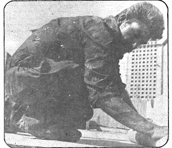
تا آخر عمر ثروتی بجز دو بازوی کار ندارند، با اینهمه حاضرند آنها را هم در راه پیروزی انقلاب فدا کنند.

انقلابی بزرگ در ایران صورت گرفته است. در این انقلاب، توده‌های زحمتکش شهری و روستایی با دل‌وجان شرکت کردند و با نثار خون خود آن را به ثمر رساندند. اکنون که بیش از یک سال و نیم از پیروزی انقلاب می‌گذرد، این مردم زحمتکش برای حفظ دستاوردهای انقلاب و تحکیم جمهوری اسلامی ایران حاضرند جان خود را نثار کنند. به عنوان نمونه می‌توان از شرکت‌گردان عظیم کارگران