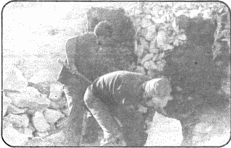
دشمن در کمین است، محرومیت‌های ما باور نکردنی است، ولی فعلا در درجه دوم اهمیت است.

تجاوز دارودسته صدام حسین به ایران بیش از پیش نقش عظیم طبقه کارگر را در امر حفظ انقلاب و دفاع از دستاوردهای آن برجسته می‌کند، زیرا بقول امام خمینی: انقلاب مال آنهاست و آن‌ها بودند که انقلاب کردند و همان‌ها هستند که کمر همت به محو کلیه آثار امپریالیسم و نابودی وابستگی به امپریالیسم بسته‌اند.