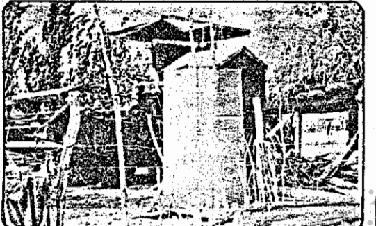
در منطقه بندر ترکمن، کشاورزی نیاز به سازماندهی جدی مردمی دارد. تا کمباین زیربوری و آفتاب یکسان بکار نماند (سخت چه عکس). توالی غیربهداشتی مرکزیمای‌ها نباشد (وسع عکس او کرده‌ام). (سخت راست عکس) بهترین بازدهی برای تغلیف کاواها داشته‌اند.