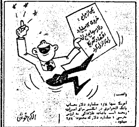
۱۸ میلیارد دلار بحال بانک مرکزی در اختیار سروا بررسی است با نماند طلاهای مهری ۱ میلیارد دلار که محتوی ۲۸ میلون