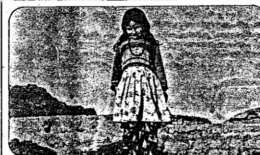
یک دختر دهقان از روستاهای سرخین از توابع اردبیل

روستای گلخوران ونیس، دار ۴ کیلومتری آب معدنی سرخین قشور گرفته از توابع شهرستان اردبیل است. این روستا ۱۳ خانوار را در بر می‌گیرد، که ۱۲ آنها خوش شین هستند. اکثر اهالی می‌کارند و بسیاری بافتن کار به تهران می‌روند، بطوری که در زمستان تعداد مردمان روستا بسیار کم می‌شود.