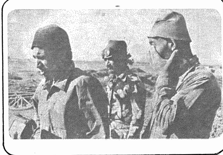
کمترین فایده انقلاب برای ما این بود که زورگوئی کارفرما کم شد. آینده هم روشن است!

خودم هم، با تخریب‌ها نوا ده منروح نبود، با او میرفتم. روزانه هفتاد تومان حقوق می‌گیرم و با این گرانی بزرگ می‌توانیم زندگیمان را تا مین کنیم. درباره وضع زندگی پس از انقلاب می‌گوید: "قبل از انقلاب کارفرما زیاد زارمان می‌داد. ولی از