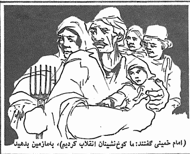
(امام خمینی گفتند: ما کوخ نشینان انقلاب کردیم)، به مازمین بدهید

بدهید! آنها با تحریک و تفرقه اندازی تاکنون توانسته‌اند دهقانان را رودروی هم قرار دهند و خود از آب گل آلود ماهی بگیرند. فتودالها و بزرگ مالکان غارتگر، پایگاه میریالیسم و ارتجاع در دهات هستند و با یستی آنها را ریشه کن کرد، تا انقلاب رشد کند و تولید کشاورزی افزایش یابد و ما از وابستگی به خارج بی‌نیاز شویم. دهقانان از مقامات مسئول جهاد سازندگی و پاسداران متعهد انقلاب طلب میکنند که هر چه زودتر دست فتودالها را از این منطقه کوتاه و توطئه آنها را خنثی کنند. شورای ده وسیله مطمئن اتحاد دهقانان، علیه بر توطئه‌های فتودالها و گرفتن قطعی زمین است. دهقانان باید متحدان شورای ده خود حمایت کنند و فعالانه در کلیه امور مربوط به آن مشارکت داشته باشند.