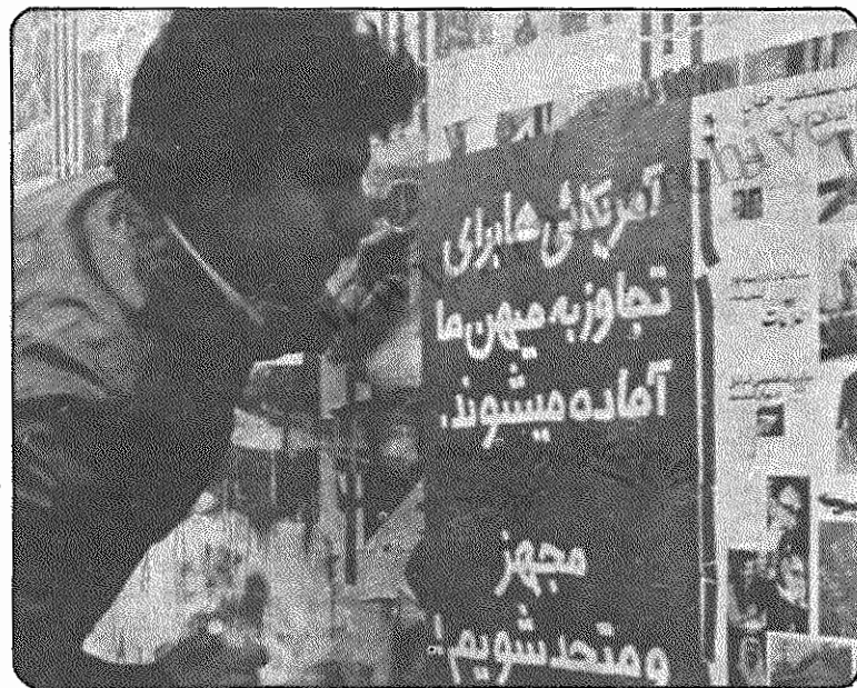
چنانکه در سه عکس فوق ملاحظه میکنید، یک مائوئیست آمریکائی روی شعار «آمریکائیها برای تجاوز به مین ما آماده میشوند، مجهز و متحد شویم» می نویسد:

«و امپریالیسم شوروی و ستون پنجم آن حزب توده و چریکهای اکثریت».