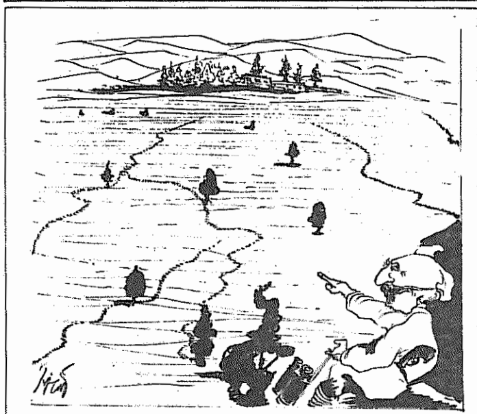
فتوادال: زمین مال من است. دلم نخواست کشت هم نمی کنم!

اهالی روستای "رودبارسا"، با توجه به شرایط حساس کشور ما و اولویت های که در سطح میهن برای مقابله با تجاوز آمریکائی صدام وجود دارد،