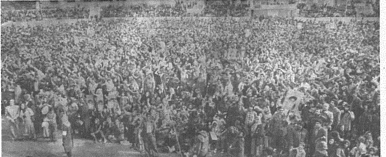
میتینگ به مناسبت جشن اول ماه مه - استادبوم نصیری

زحمتکشان ایران شعار «مرگ بر آمریکا» را پرچم مبارزه خویش می‌دانند