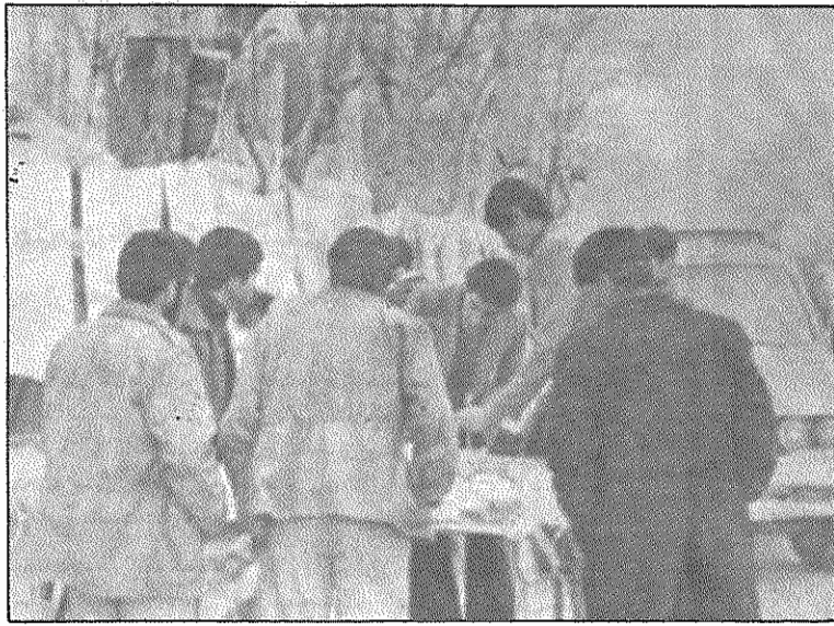
در اسلام آباد غرب نمایشگاهی از فعالیتهای جهاد سازندگی تشکیل شد

جهاد سازندگی از جمله نهادهای انقلابیست که افراد آن از بدو تاسیس، علیرغم کارشکنیها و اشکال تراشیهای دولت موقت و وزیر کشاورزی بزرگ مالک آن و دیگر بزرگ مالکان و عوامل و یادی آن، در جهت پاسخگویی به خواستها و نیازهای فرهنگی، کشاورزی، عمرانی، فنی و درمانی روستائیان زحمتکش، رهسپار روستاها شدند و در حد توانایی منشاء خدمات ارزندهای گشتند. آنها در این راه از یاری سپاه پاسداران، نهاد انقلابی دیگر بهره فراوان بردند. افراد جهاد، این مبشران خدمت به مردم و کوشندگان راه محرومان، با آغاز جنگ تحمیلی صدام به ایران انقلابی نیز، همراه با دیگر هم میهنان دلیر و رزمنده خود، به تلاشی عظیم بمنظور تقویت جبهه و پشت جبهه انقلاب پرداختند، که کارسازگاری آنان همچنان با شورو فداکاری فراوان ادامه دارد.