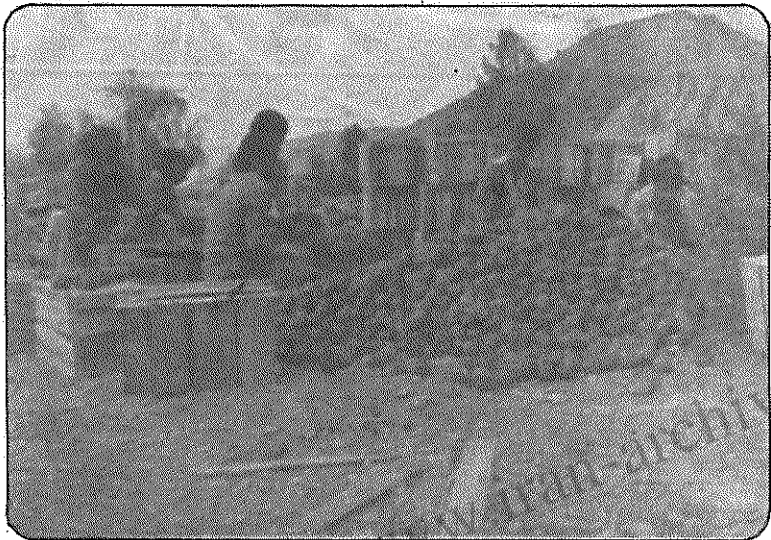
دهقانان هنگام چیدن نارنگی در صندوق

این روستا فاقد آب لوله‌کشی است و اهالی برای تامین آب آشامیدنی از قناتی که روستای پهلوپی را مشروب می‌سازد، استفاده می‌کنند. این قنات تا روستا ۵۰ متر فاصله دارد، که زنان