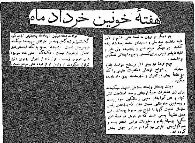
هفته خونین خرداد ماه

به مناسبت هجدهمین قیام تاریخی سالگرد ۱۵ خرداد - قسمت دوم