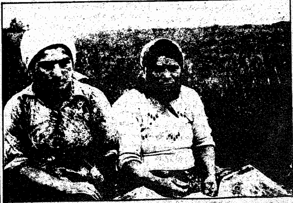
زنان زحمتکش روستائی بعد از نظافت فرسای روزانه

با پاسخ مثبت به خواست زنان زحمتکش مبین ما ، از جمله دانش آموزان و علاقمندان به تحصیل و همچنین " مادر یاران " به تعمیق دستاوردهای خلقی انقلاب کمک کنیم و دست قانون شکنان را کوتاه بمانیم .