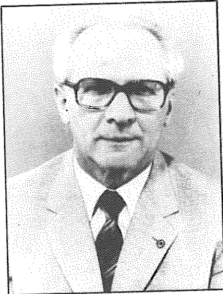
ارش هونار، دبیرکل حزب سوسیالیست متحد آلمان