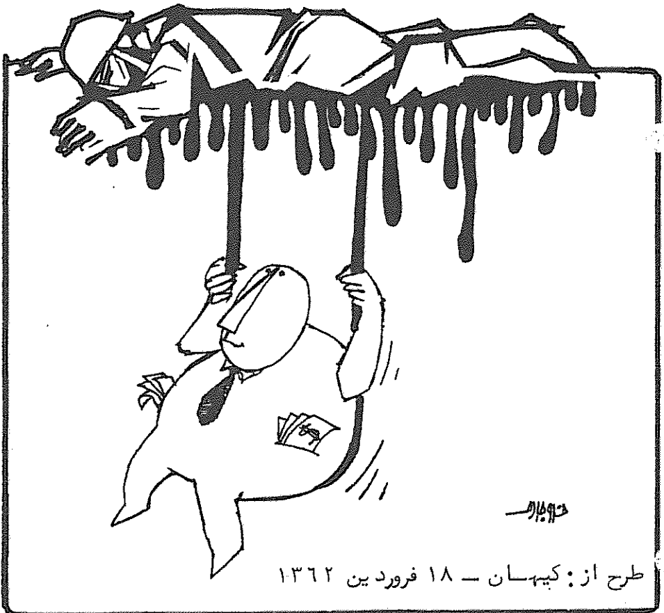
طرح از: کیهان - ۱۸ فروردین ۱۳۶۲

از مالکیت خانه‌های متعدد و کاخ‌های مجلل و مالکیت کارخانه‌های عظیم و مالکیت زمینهای زراعی چند صد هکتاری نامشروع است! هم چنانکه امام در سخنانشان خطاب به شورای محترم نگهبان فرمودند: "اگر تمام اموالشان هم گرفته شود باز هم بابت حقوق شرعی‌شان یک چیستی بد هکارند" آخر کدام عقل میتواند قبول کند که فلان خان خود به تنهایی توانسته باشد صد ها هکتار زمین را آباد کند، که بعد آنرا به ارث به خان زاده بدهد؟ آخر چه عقل سلیمی می‌پذیرد که یک فرد کاسب یا تاجر با تجارت طبق موازین شرع مقدس اسلام، بتواند ظرف مدت چند سال هزار تومان را به یک میلیارد تومان برساند؟ آیا بهتر نیست که شما برادران محترم بقول حضرت موسوی اردبیلی بپرونده بانکها، ثبت اسناد و