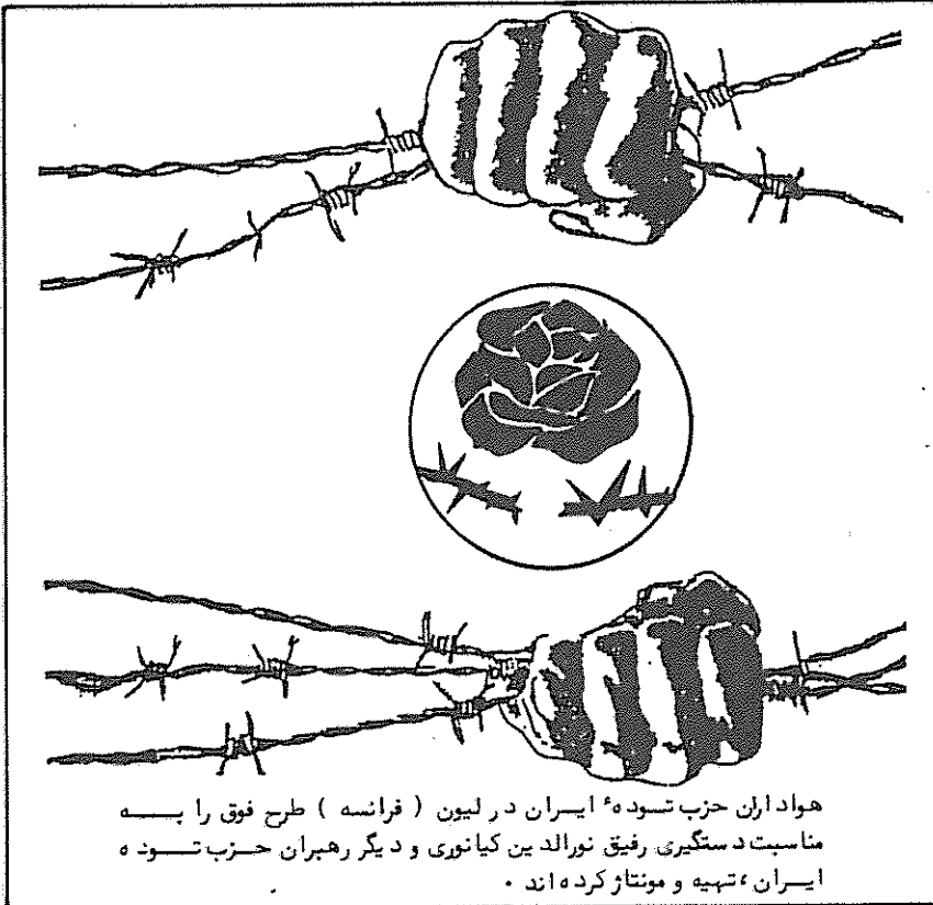
هواداران حزب توده ایران در لیون ( فرانسه ) طرح فوق را پسه مناسبت دستگیری رفیق نورالدین کیانوری و دیگر رهبران حزب توده ایران، تهیه و منتشر کرده اند.

" تجربه تاریخی بما می آموزد که در همه جا تهاجم علیه احزاب کمونیستی و کارگری سر آغاز در هم شکستن انقلابات بوده است. از اینرو، توطئه کنونی بر علیه حزب توده ایران، خطر واقعی توطئه بزرگتر محافل راست و امپریالیستی برای درهم شکستن انقلاب ضد امپریالیستی و سرنگونی جمهوری اسلامی را به