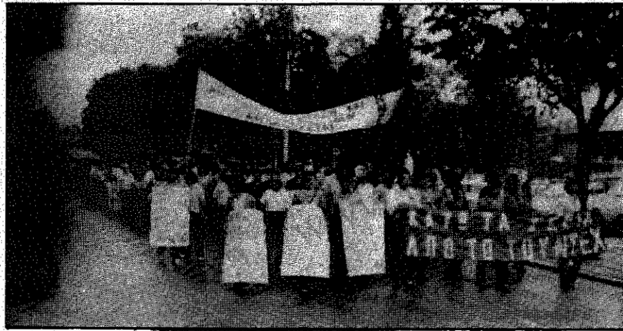
هزاران نفر با شعار "دشمنان از حزب توده ایران کوتاه باد" در شهر سالونیک (یونان) در تظاهرات با تکیه حرکت کردند.

کنفدراسیون عمومی کار ایتالیا، CGIL (سندیکای سراسری کارگران) طی ارسال نامه‌ای به سفارت ج ۱۰۱۰ در ایران، مراتب نگرانی خود را از بازداشت و شکنجه رهبران و اعضای حزب توده، ایران و اعمال پیگرد در مورد سایر میهن پرستان، ابراز می‌دارند. در نامه از جمله آمده است: "در میان بازداشت شدگان توده‌ای، مبارزینی بچشم می‌خورند که سالیان سال تحت پیگرد حکومت دیکتاتوری پهلوی بودند و بازداشت آنان بدست حکومت ج ۱۰۱۰ موجی از