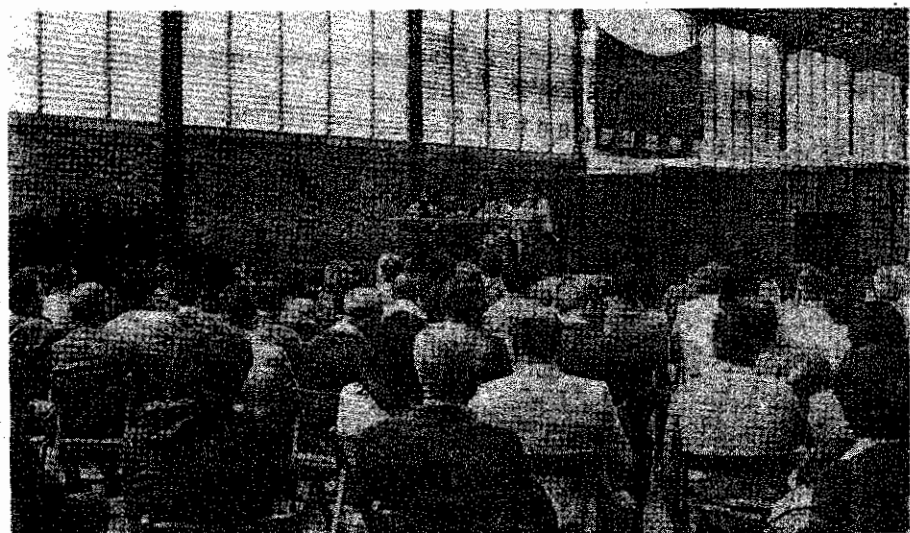
در کنفرانس ویژه بررسی اوضاع خاورمیانه، یکی از اعضای حزب توده ایران در رابطه با دستگیری و شکنجه توده‌ای‌های دربند سخن می‌گوید.

قطعنامه همچنین، خواستار اعزام هیأتی بین‌المللی مرکب از پزشکان متخصص و حقوقدانان، جهت بررسی وضع زندانیان و تشکیل دادگاههای علنی برای کلیه مبارزین راه صلح و آزادی در ایران، با حضور ناظرین بین-بقیه در صفحه ۱۶