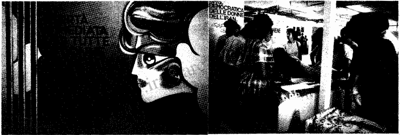
نمای داخلی غرفه تشکیلات دمکراتیک زنان در جشن ناسیونال اونیتا رجو امیلیا

در هفته‌های اخیر نیز چون گذشته، محافل مترقی جهان در راه نجات این قربانیان پیگیرانه کوشیدند و یک صدا درخواست قطع شکنجه آزادی زندانیان، بررسی وضع آنان از نزدیک تأیید و رسیدند. با این حال، حاکمیت نج ۱۰۱۰ بجای توجه و گردن نهادن به این خواستها، باز هم در سیاهچالهای مخوف خود به زجر و شکنجه مبارزین دریند ادامه می‌دهد و با این عمل، ماهیت ضد بشری و ضد انسانی خود را