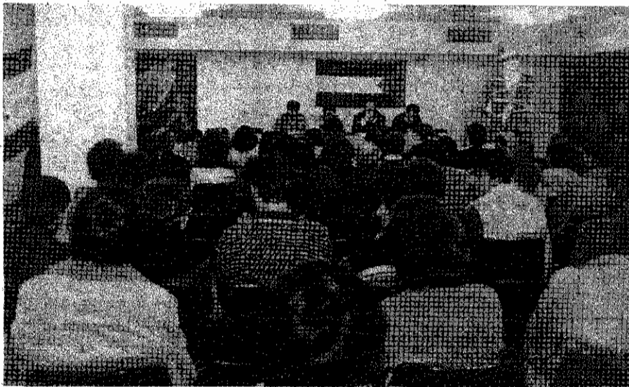
جلسه همبستگی با حزب توده ه ایران در بارسلن ( اسپانیا )

● جمعی از مسئولین سندیکائی در کاتالونیا ، اقدام به انتشار و ارسال بیانیه ای به آدرس سفارت چ ۱۰۱۰ در اسپانیا نمودند و در آن ، اعمال تضيقات نسبت به تشکل های کارگری و بازداشت ، شکنجه و قتل فعالین جنبش کارگری را در ایران ، محکوم کردند . آنان ، این گونه اعمال غیرقانونی را به منزله