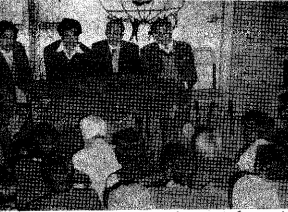
جلسه همبستگی اتحادیه کارگری و حزب کمونیست هندوستان در پنجاب با حزب توده " ایران و اعضای در بند آن

طی برگزاری جلسه فوق ، نامهای از طرف هواداران حزب توده " ایران و هواداران سازمان فدائیان خلق ایران ( اکثریت ) در هندوستان بقیه در صفحه ۷