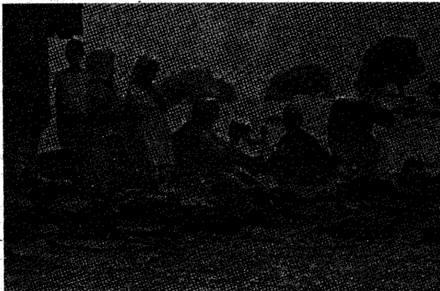
عشایر فشانیا بی‌پس از اسبها حرکت، در حال استراحت هستند.

ادامه جنگ بیپرده بین ایران و عراق که جز تأمین اهداف شوم امپریالیسم جهانی و در رأس آن امپریالیسم آمریکا و تحکیم مواضع ارتجاع در کشور حاصلی به بار نیامد، بر تیره روزی آنان می‌افزاید. خانواده‌های عشایر زحمتکش و دام‌هایشان، که تنها ثروت و دارائی آنان را تشکیل می‌دهد، پیوسته در معرض بیماریان و حمله های موشکی قرار دارند. با تبدیل شدن مراتع