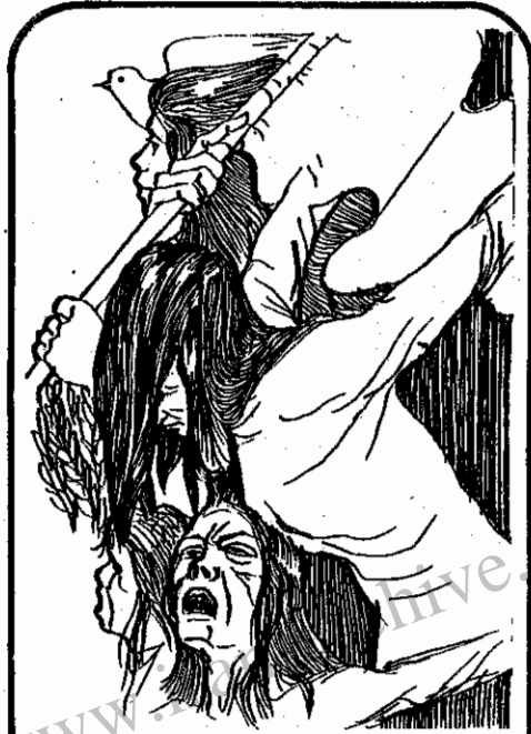
بازن محروم ایرانی

پرورش ، بهداشت و سایر شئون زندگی کارگران بیش از پیش ، فراهم گردد . این‌ها ، نکاتی است که زنان کارگر ، همپای مردان هم طبقه خود ، بسا وحدت و تشکل ، مطالبه می‌کنند و برای کسب و تثبیت آن مبارزه خواهند کرد .