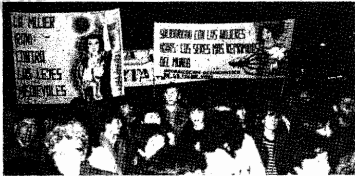
تظاهرات با شکوه هشتم مارس در بارسلون

طی این مراسم اعلامیه تشکیلات دمکراتیک زنان ایران، به مقیاس چند هزار نسخه پخش گردید و قطعنامه سازمان، مبنی برخواست محکوم کردن جنایات رژیم جمهوری اسلامی در قبال زنان و مردان مبارز زندانی و آزادی آنان و نیز پایان بخشیدن به جنگ ایران و عراق، مورد تصویب نمایندگان شرکت کننده در جلسه