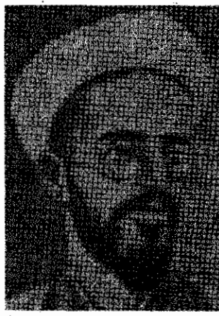
شیخ محمد خیابانی

۱۶ فروردین امسال، ۶۴ سال از قیام مردم آذربایجان به رهبری شیخ محمد خیابانی و ۱۲ فروردین، ۶۳ سال از آغاز قیام مردم خراسان به رهبری کلنل محمدتقی خان پسیان گذشت.