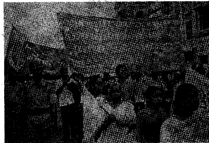
تظاهرات با شکوه مردم مترقی در شهر مدرس

مترقی پیرامون این مسائل سخنانی ایراد کردند و جلگه، تفضیقات وارده بر نیروهای مترقی، به ویژه حزب توده ایران و سازمان فداییان خلق ایران (اکثریت) را محکوم کردند.