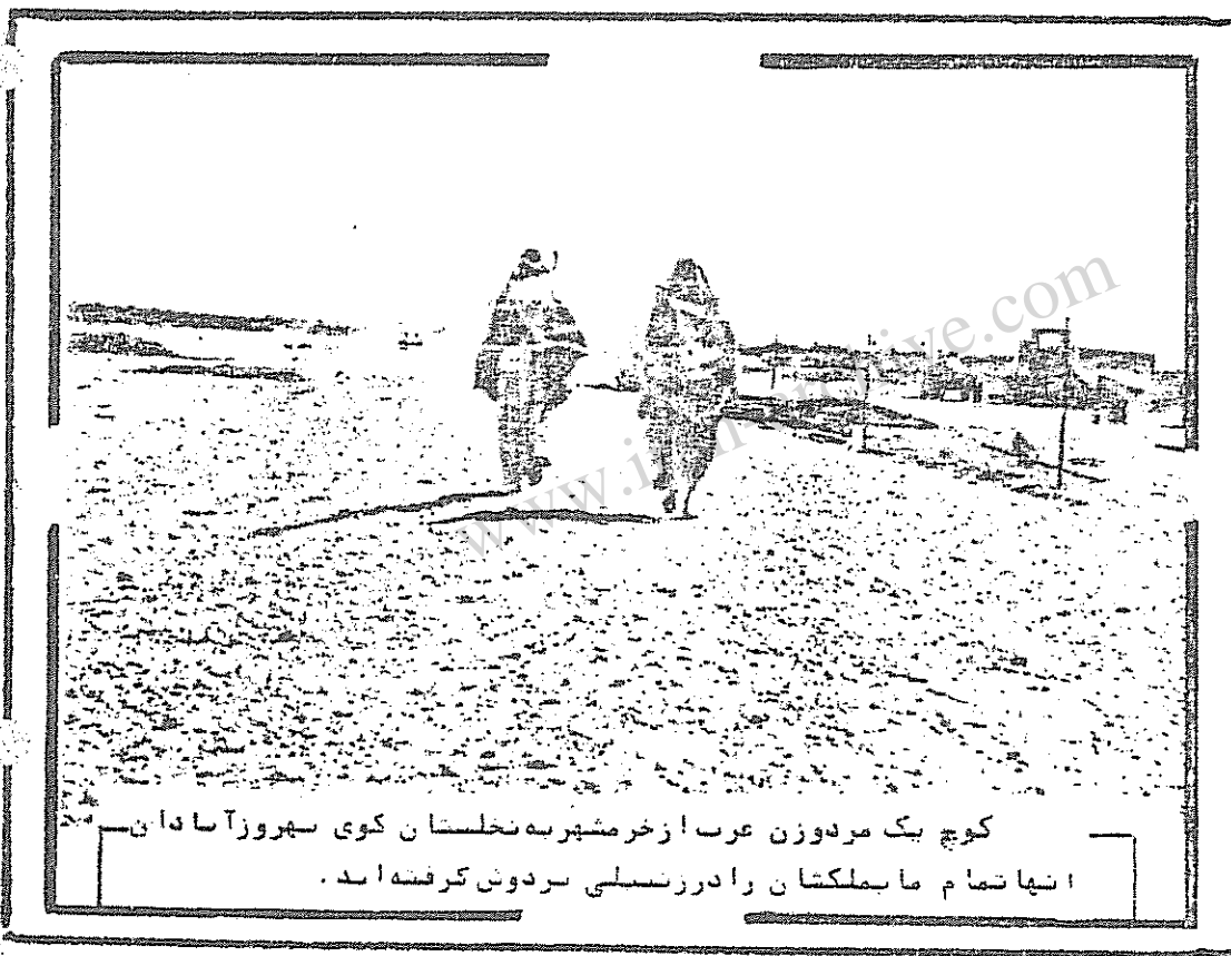
کوچ یک مردوزن عرب از خرمشهر به نخلستان کوی بهروز آبادان - انها تمام ما بملکشان را در زنجیلی بردوش گرفته اند .

یکی از ریش رها کرده های جمهوری اسلامی ایران - خاش کتبان فریاد زد ، همون شاه خلاد ، همون شاه خاش برا -تون حوس بود ، واقعا "که حوستو سرتون میزد . زنی که د و بچه همراه داشتو ساکن خرمشهر بود پرسید : مگه شما نمی زنین ؟ مگه شما نمی کشین ؟ شماروی اون خلاد اون خاش را سفید کردین ، بدبختا برین نومردم ببینین درموردتون چه میگن . مثل کبک