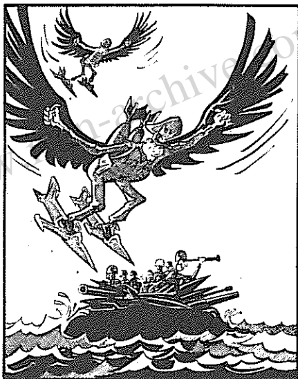
جزیره دیگو گارسیا — لانکسرکسهای پنتاگون

پنجمین کنفرانس جنبش کشورهای غیرمتعهد که با کامیابی کار خود را با انجام رسانیدن در مبارزه خلقها علیه امپریالیسم و سیاست نواستعمار بود راه استحکام مبنای استقلال کشورهای نواستقلال و همچنین مبارزه در راه صلح و و خاتمه زدائی عامل موثر و مهمی خواهد بود . مبارزه جنبش کشورهای در حال رشد برای استقلال کامل خود روندی است که با نیل به هدفهای خویش ، پایه امپریالیسم غارتگر را بیش از پیش سست خواهد کرد و تحول بنیادی انقلابی را در جامعه انسانی نزدیکتر خواهد ساخت .