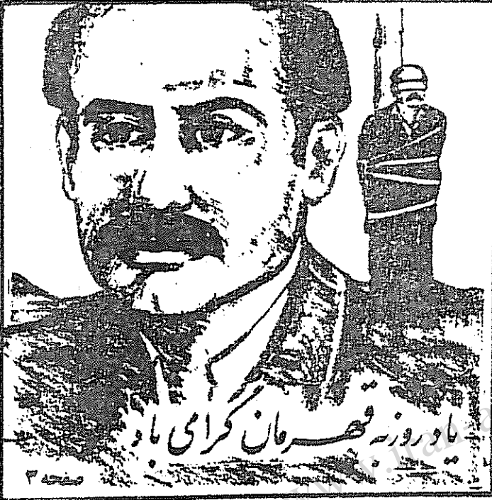
یاوروزنه قهرمان گرامی ما

روزنامه ساعت ۷/۳۰ صبح تاریخ ۶۰/۲/۵ تعداد ۳۵۰۰ ۴۰۰ نفر، طبق گزارش کد ارتش جهاد سازندگی به کارگران کشته شده بود. در این مورد در حیطه جهاد جمع شد تا اسم کارگران نوشته شود که برای آنها کار رسد اکند (صفحه در صفحه ۱۰)