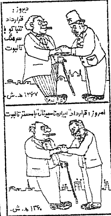
امروز: قرارداد ایران... ش. ۱۳۶۷ ش. ۱۳۶۰