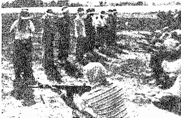
اعدام انقلابیون در کردستان - قاسمان ۵۸

او سالها از فرماندهان گروه های ضربت رژیم در کردستان بود و مدتی هم در اطلاعات سپاه پاسداران شهر سنندج به جنایت اشتغال داشت. مجازات این مهره کثیف که در هر فرصت ممکن برای اذیت و آزار خانواده های پیشمرگان جانباخته، کاروانچیان و مردم عادی استفاده می کرد در منطقه انمکاس وسیعی یافت و با استقبال و شادی توده ها و مبارزان انقلابی همراه شد. از میان مطبوعات رژیم، کیهان به عنوان نشریه غیررسمی اطلاعات سپاه پاسداران صحنه کتان به شرح خدمات وی به نظام اسلامی