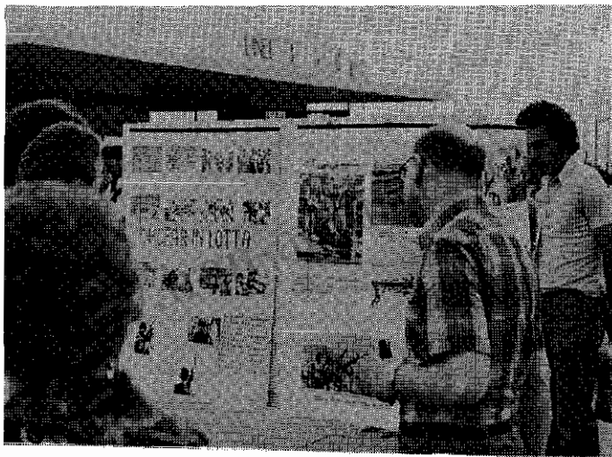
نمایشگاه عکس جوانان و دانشجویان دمکرات در گرنوبل

تشکیل میدادند • جوانان و دانشجویان دمکرات بوسعت به پرده دری از چهارم — سه فاشیستی شاه و آگاه کردن افکار عمومی از وضع زندانیان سیاسی و جنایت رژیم در باره بقتل رساندن ۹ زندانی سیاسی پرداختند و قریب ۷۰۰ امضاء اعتراضی به این جنایتاً رژیم جمع آوری کردند • آرمان : امضاء های اعتراضی برای کمیسیون حقوق بشر سازمان ملل متحد ارسال شد