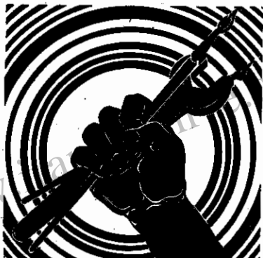
نمایشنامه کاوه آهنگر

تاکی خاموشید شما ، ای توده چکش و داس در دست ، و تا کی خاموشید شما ، ای توده قلم در یسد ! تو ای کارگر خاموش منشین و چکشت را مخکتر از همیشه در دست بگیر و تو ای دهقان داس را بهتر از همیشه تیز کن ! و من قلم را در دست میگیرم ، من با قلم طرحی خواهم ریخت ، تو با داس ریشه دشمن را از خاک بگیر ، و تو با چکشت بر فرقه زن و آیندگان تاریخ را ورق میزنند ، آنگه است که ما نمایشنامه کاوه آهنگر را بر روی پرده آورده ایم .