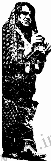
" این زن را پدرش مال و زنجیر کرده است "