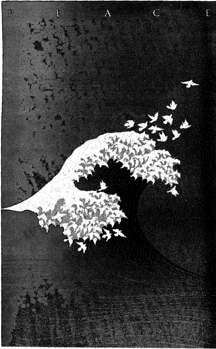
اثر "ماکلبی مک ری" طراح امریکایی ، برنده جایزه اول سالن بین المللی آفیشیونسکو