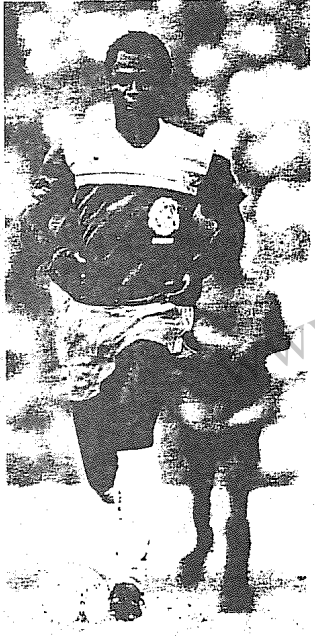
"امانوئل کونده" ۳۴ ساله ستاره درخشان گامرون، تیم شایسته درواول جام جهانی

پیام کارگر: درمسابقات جام جهانی آرژانتین، طریغم آنکه بنسنان کاپیتان تیجعت شدمیدی شرکت نکردی، چرا؟ بروز: بازیای جام جهانی آرژانتین هزمان بااوچگری مبارزات بردم علیه رژیم شاهمید. من درآنیوتیترین آفریکایی "سن خوزه" بازی می کردم. ازمن دعوت شدکنرمسابقات جام جهانی شرکت کنم، اما بنسوان اعتراضی به اعمال رژیم شاهشاهی شرکت در آن مسابقات راتحرم کردیم. بدلیل عذرشکت من توجهمافسل مختلف ورزشی وسیاسی به این تحریم جلب نشودینصاحبه هاگفتگوهای رادیویونیونیون تیغریزم وانفای آن داشت.