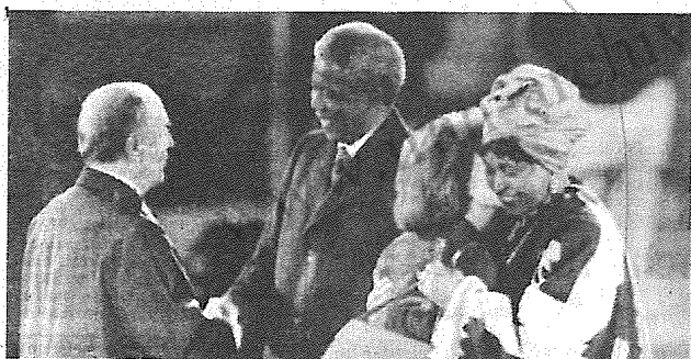
ماندلا در آغاز سفر جهانی خود در پاریس در صفحه ۹