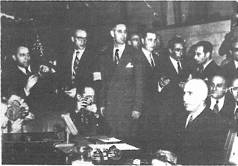
دکتر مصدق در سازمان ملل