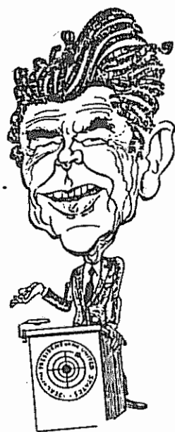
فروری پر دکترین ریگان (۳)