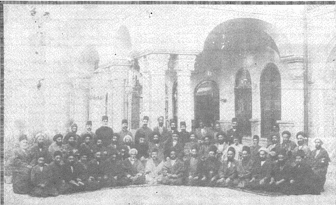
نمایندگان دوره اول مجلس شورای ملی