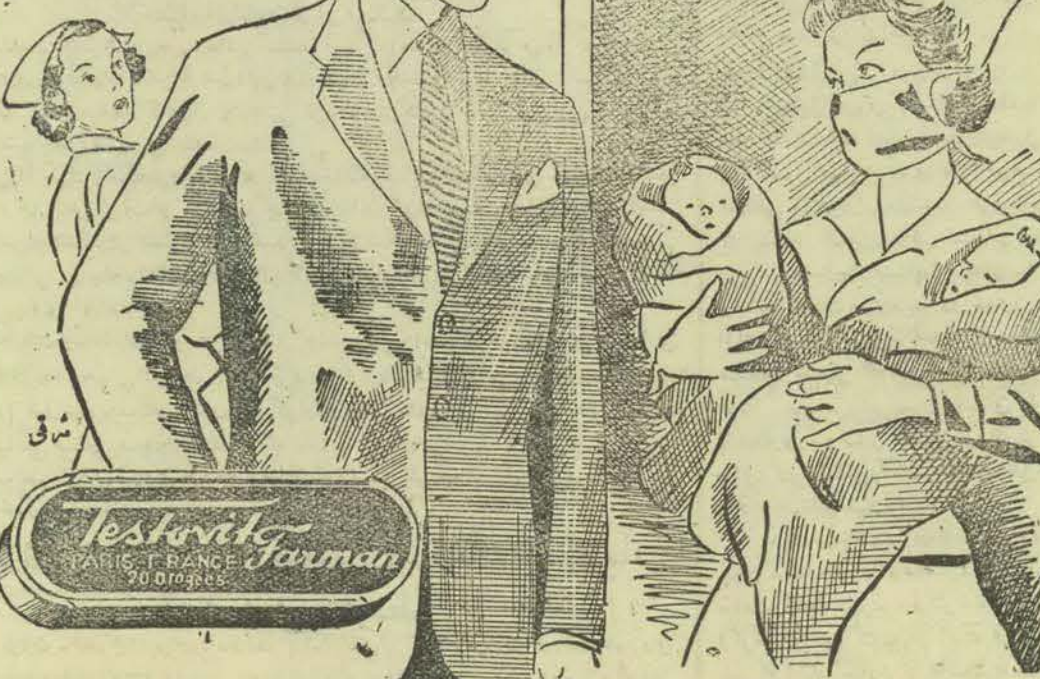
مرکز فروش ناصر خسرو بنگاه داروئی طوسی

فروم: تستوون همگام با نیازهای روزگار هدايت‌رکيب همگام با عده‌های مختلف هدايت‌رکيب همگام با عده‌های مختلف هدايت‌رکيب همگام با عده‌های مختلف هدايت‌رکيب همگام با عده‌های مختلف