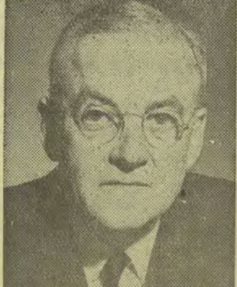
واشنگتن - آسوشیتد پرس - دیروز فوستردال وزیر امور خارجه آمریکا ضمن مصاحبه مطبوعاتی نگرانی خود را نسبت بفعالیت روز افزون حزب متحله کمونیست توده در ایران اعلام کرد و اضافه کرد که با در نظر گرفتن سیر تحول سیاسی فنی در ایران برای دولت آمریکا پیش از این مشکلتر خواهد بود که بدولت ایران کمک کند.

خبرگزاری فرانسه از واشنگتن اطلاع میدهد جان فوستردال وزیر امور خارجه آمریکا طی مصاحبه مطبوعاتی امروز خود اظهار داشت نظر باینکه دولت ایران بیش از پیش فعالیت های غیرقانونی حزب توده را تحمل میکند اعطاء کمک از طرف آمریکا بایران را مشکل تر میسازد و این وضعیت باعث نگرانی بسیار دولت آمریکا است.