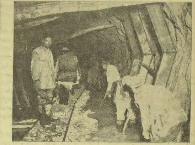
آخرین قسمت تونل کوه رنگ محل خروج (مظهر آب) است که ساختمان آن در شرف اتمام است شرح در صفحه ۸

در هر ماه صد گوه رنگ افتتاح خواهد شد ساختمان تونل کوه رنگ بزودی پایان می یابد