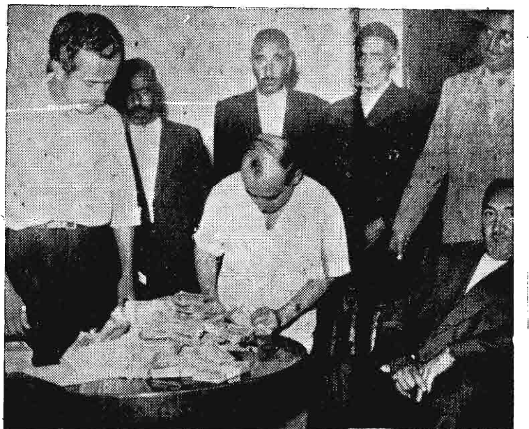
عصر دیروز بولهاییکه جاعلین کدر نامه ها از مردم گرفته بودند توسط شهر بانی آنها مسترد شد (شرح جزو اخبار)

دولت شوروی افراد آن کشور را بصورت ماشین های بی اراده ای در آورده است. مالنگف میخواهد بین دولت های باختری اختلاف نظر ایجاد نماید. بنظر دالس اظهارات نخست وزیر شوروی درباره ساختمان بمب نپدرژنی، ادعائی بیش نیست. (بقیه در صفحه ۳)