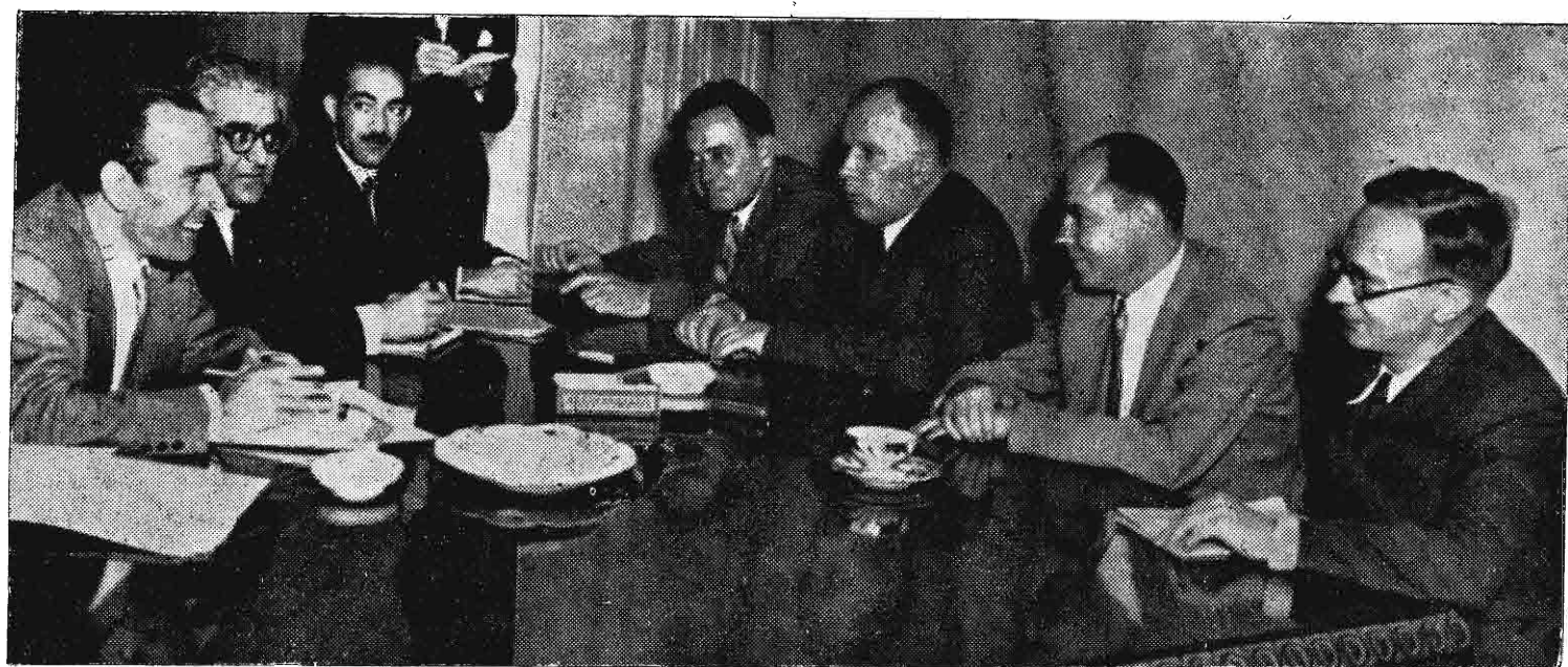
صبح امروز اولین جلسه کمیسیون مشترک ایران و شوروی، برای رفع اختلافات مرزی و مالی تشکیل شد در عکس بالا از چپ بر راست وزیر امور خارجه - معاون وزارت خارجه - منشی وزیر - وابسته بازرگانی شوروی - سفیر کبیر روسیه و مترجم و وابسته مطبوعاتی روسیه دیده میشوند

صبح امروز اولین جلسه مذاکرات ایران و شوروی برای رفع اختلافات مالی و مرزی بر ریاست وزیر امور خارجه تشکیل گردید سفیر کبیر جدید شوروی و یکی از دبیرمات های مخصوص وزارت خارجه شوروی با دو نفر مترجم بنمایندگی آن کشور در جلسه امروز شرکت داشتند در جلسه امروز که دو ساعت و نیم بطول انجامید دستور جلسات بعد تعیین گردید پرونده های مطالبات ایران و اختلافات مرزی در اختیار وزیر امور خارجه میباشد دومین جلسه مذاکرات هیئت نمایندگان ایران و شوروی صبح روز شنبه تشکیل میشود