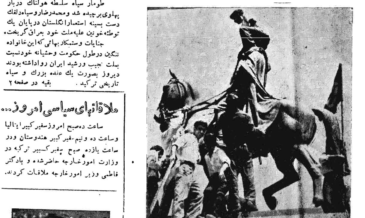
۲۰ سال رضاخان میر پنج بدستاری انگلیسیها بر کردن ملت سوار بود، دیروز ملت برای سرنگون ساختن مجسمه او بر کردنش سوار گردید.

مات بت شکن جوانان پر شور و مبارز احزاب ملی از صبح دیروز اقدام به پائین آوردن مجسمه های دیکتاتور ۲۰ ساله و پسر خیانتکارش نمودند در میدان های مختلف شهر همه جا مردم مبارز و شرافتمند تهران فریاد شادی و شغف میکشیدند پس از ۲۲ سال عصر دیر و زائری از بت های خاندان پهلوی در میدان های مختلف شهر دیده نمیشد. ما پیشنهاد میکنیم که مجسمه های دیکتاتور سیه کار را برای ضبط در موزه جنایات خاندان پهلوی نگاهداری کنند