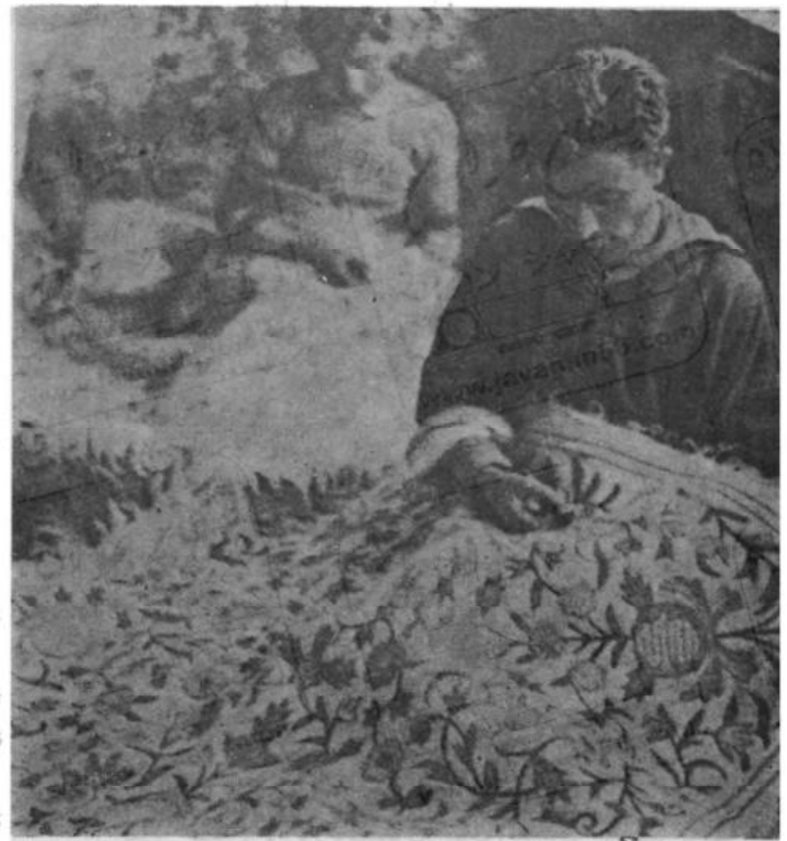
هنرمندان کشمیری در حال گلدوزی بر روی نم

نیروی برق: قبل از اجرای برنامه‌های پنجساله هند (۱۹۵۰-۵۱) فقط ده شهر و دهکده در ایالت جامو و کشمیر نیروی برق داشتند ولی تا پایان ماه مارس ۱۹۶۷ نیروی