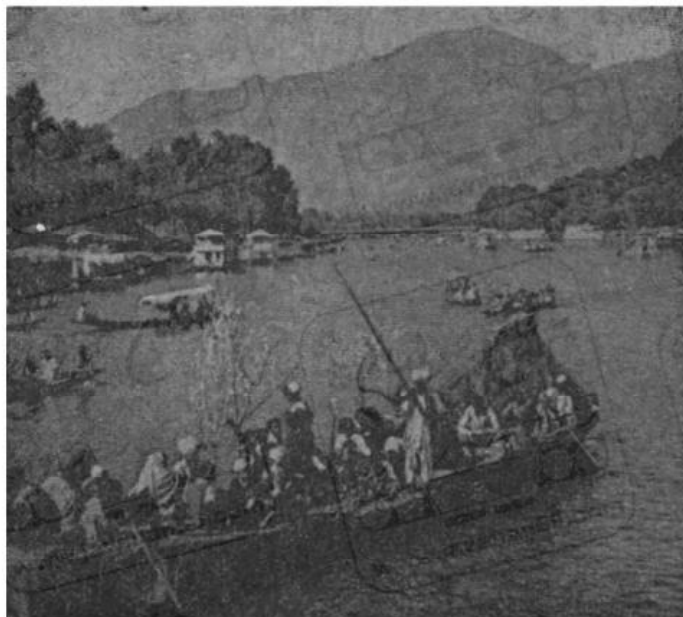
قایقرانی در کشمیر

به پیروی از خط مشی جدید دولت هند کشاورزان کشمیری نیز از بندر اصلاح شده ، کود شیمیائی و طرق جدید آبیاری استفاده میکنند . در نتیجه در هر هکتار اراضی زیر کشت برنج از ۹۶۹ قنطال (۹۶۹ کیلو) در سال ۱۹۵۱-۵۲ به ۱۲۱۷ قنطال (۱۲۱۷ کیلو) در سال ۱۹۶۶-۶۷ و محصول ذرت از ۸۰ قنطال (۸۰ کیلو) به ۲۳۳ قنطال (۲۳۳ کیلو) و محصول گندم از ۳۸۸ قنطال (۳۸۸ کیلو) به ۶۵۷ قنطال (۶۵۷ کیلو) در سال ۱۹۶۵-۶۶ افزایش یافت . قبل جمع آوری محصول امسال انتظار میرفت که تولیدات برنج ایالت جامو و کشمیر برای سال ۱۹۶۷-۶۸ در حدود ۵۲۰۰۰ تن برسد ولی این رقم به ۷۸۰۰۰ تن رسید