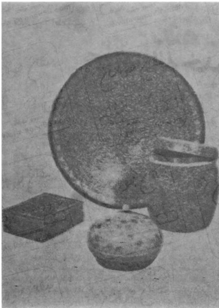
صنایع دستی کشمیر

با جامو و دهلی ارتباط مستقیم دارد بدین معنی که برای مکالمه با طرف خود میتوان با گرفتن نمره تلفن او با وی تماس گرفت بعلاوه اقداماتی برای ایجاد سیستم میکروویو برای کشمیر بعمل آمده . توسعه خط آهن از کاتوا به جامو نیز بدست گرفته شده است .