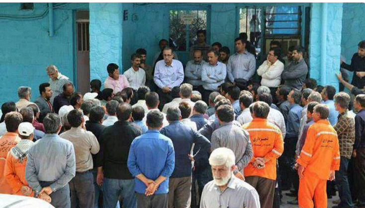
تصویری از اعتراض کارگران شهرداری شوشتر