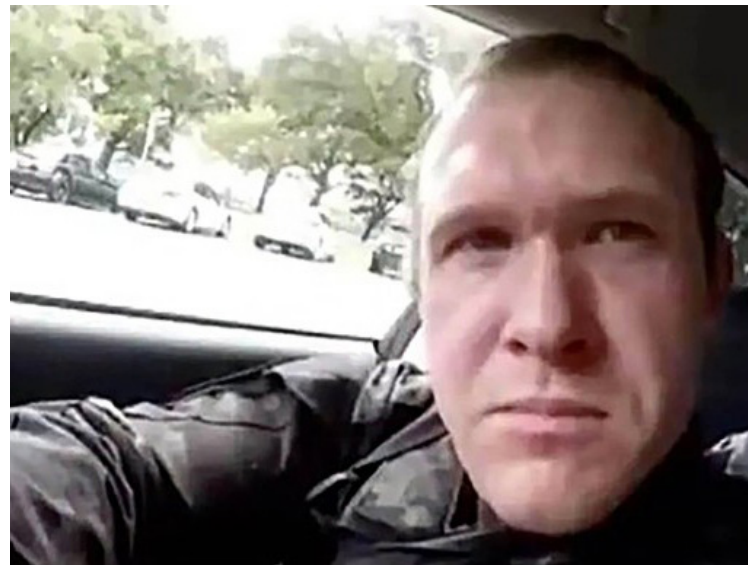
اعلامیه: در حاشیه کشتار بربرمنشانه در نیوزلند