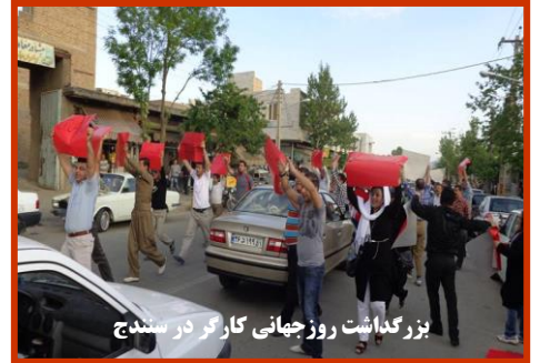
بزرگداشت روز جهانی کارگر در سنندج

خبرگزاری هرانا گزارش داد که روز شنبه ۱۱ اردیبهشت ماه (۱ می) مصادف با روز جهانی کارگر، شماری از بازنشستگان و مستمری بگبران تامین اجتماعی دستکم در ۱۶ شهر از جمله خرم‌آباد، یزد، قزوین، ساری، تهران، نیشابور، شوش، دزفول، مشهد، تبریز، کرمانشاه، کرج، اراک، اصفهان، اهواز و رشت در مقابل ساختمان سازمان تامین اجتماعی شهر خود، دست به تجمع زدند. جمعی از کارگران، فعالان کارگری و شهروندان در راستای گرامی‌داشت روز کارگر و حمایت از این قشر دستکم در ۵ شهر از جمله تهران در مقابل وزارت کار، سنندج در شهرک صنعتی شماره ۲، بانه در میدان کارگر، میوان به صورت جداگانه در محل کار و پارک شانوی این شهر و سروآباد در محل کار خود، شماری از کارگران شرکت کشت و صنعت نیشکر هفت تپه در محوطه این شرکت، گروهی از زنان بازنشسته و کارگران شرکت واحد اتوبوسرانی تهران و حومه در پایانه آزادی واقع در تهران دست به تجمع زدند. این تجمعات مسالمت آمیز با یورش مامورین امنیتی رژیم مواجه شد و در تهران در مقابل وزارت کار ده‌ها تن از تجمع‌کنندگان توسط مامورین سرکوبگر جمهوری اسلامی دستگیر شدند.