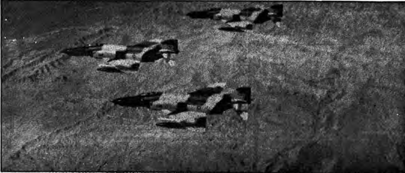
تمامی هواپیماهای چهار پایگاه نظامی عراق نابود شد

یکشنبه ۱۶ فروردین ماه ۱۳۶۰ - شماره ۵۲۷ - سال دوم تعداد: ۲۰۰۰ طی یک یورش برق آسا توسط جنگندههای تیز پرواز ارتش اسلام در قعر خاک عراق