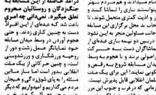
بازها و بارها سروسس ورزشی روزنامه جمهوری اسلامی نزد دوست و آشنا و ورزشکاران و ورزش دوستانم شده که روند کار این سروسس از بیرون برین نظر است و عده ای سیر مفقاری انصاف به خرج داده و مارا مدعی می خوانند...