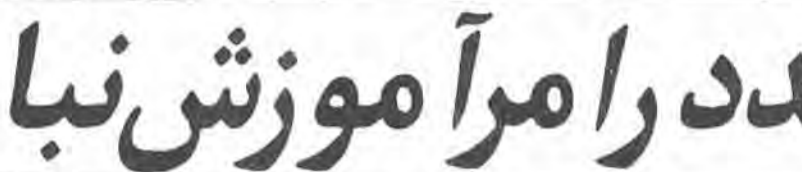
در صفحه ۵

با چماق هیچ کاری حل نمیشود جز اینکه آبروی جمهوری اسلامی می‌رود ● با اینکه با موضع‌گیری‌های آقای لاهوتی موافق نبودم چماق‌داری را شدیداً محکوم نموده و می‌نمایم ● من با موضع‌گیری‌های عمومی عزیزم حضرت آیت‌الله... پسندیده مخالفم، در عین حالیکه شدیداً به ایشان احترام می‌گذارم.