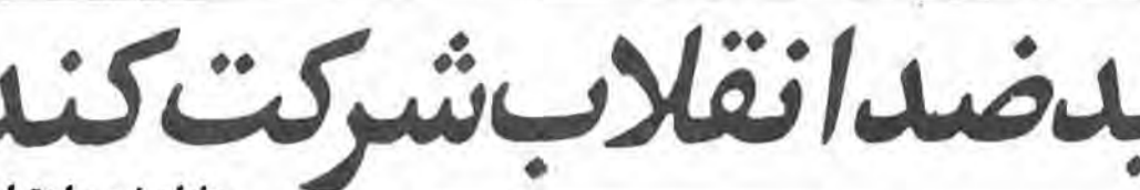
در صفحه ۵

● نشست روز گذشته هیئت با حضور دادستان کل کشور برگزار شد ● در صورتیکه هیئت قادر به حل اختلافات نباشد، متخلف را بمردم معرفی می‌کند.