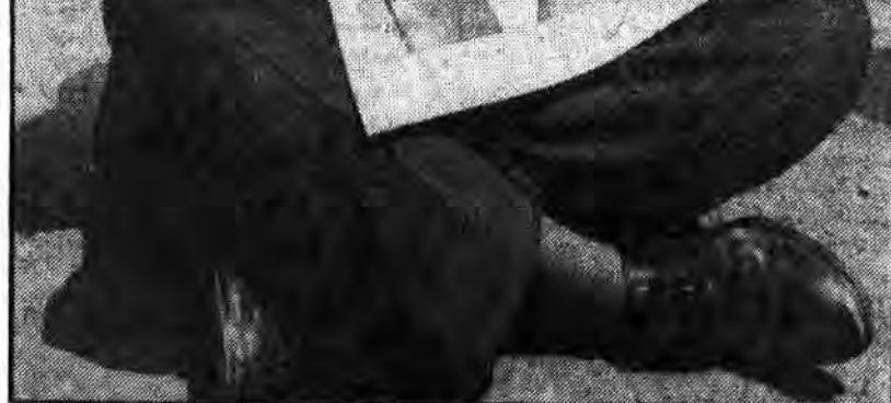
نجات این شخص که هویتش تاکنون... گروهکهای آمریکائی یکبار دیگر شکست خورد

سرویس اجتماعی- در جریان... گروهکهای آمریکائی یکبار دیگر شکست خورد