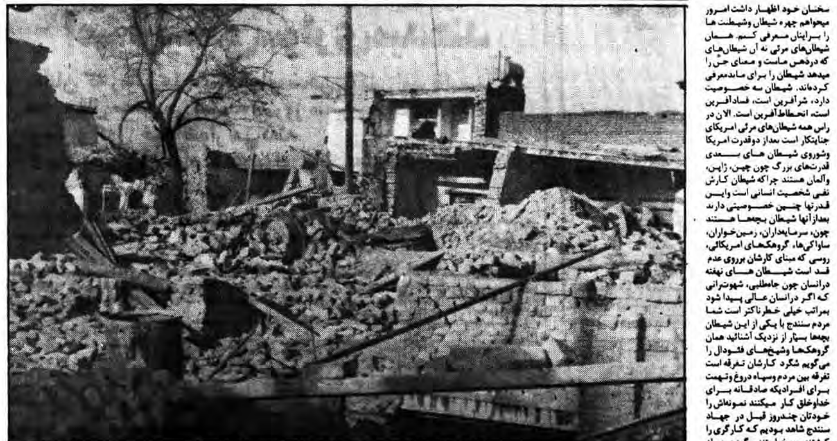
کوششی از مناطق بمباران شده شهر تهران برورد زفول