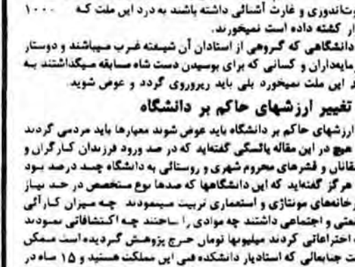
اتذیه و انالله راجعین