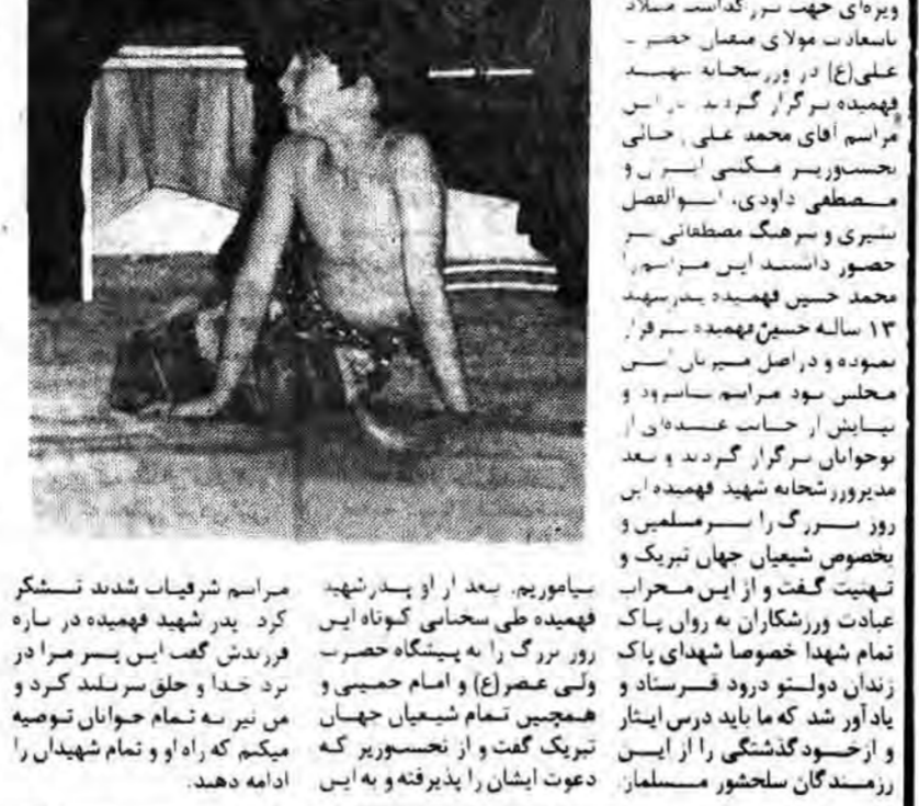
بعد از ظهر یکشنبه مراسم ویژه در روز شکار شهید...