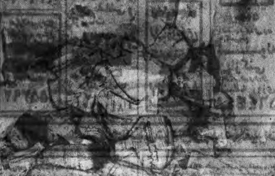
در این حمله مطبوعات موجود در دفترها به آتش کشیده شد بخصوص روزنامه‌های جمهوری اسلامی

۱- در حمله مفولها بدست چنگیز و عمال امپریالیزم