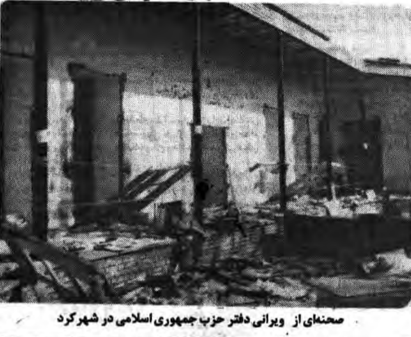
صحنای از ویرانی دفتر حزب جمهوری اسلامی در شهر کرد