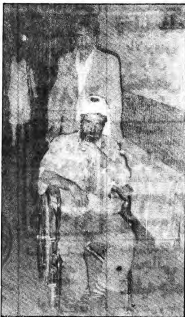
یک مجروح دیگر که بوسیله مجاهدین خلق بیهوش مورد حمله قرار گرفته است