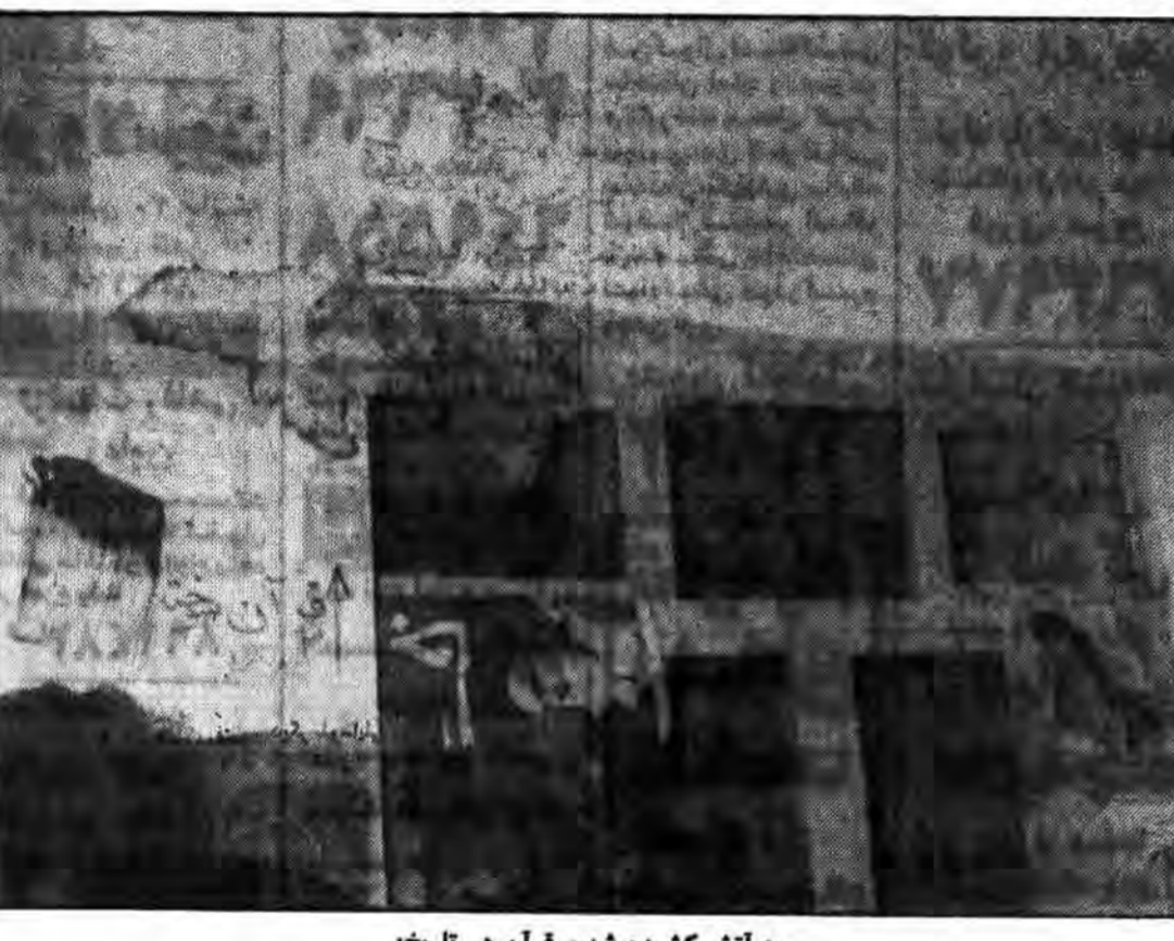
به آتش کشیده شدن قرآن در تاریخ:

و یا سعی کنید با نیروهای انتظامی بخصوص سپاه بسیج و نهادهای انقلابی درگیر بشوید چون هدف اصلی این عده این بود که مخصوصاً با سپاه وارد درگیری بشوند در نتیجه سپاه سعی کرد وارد عمل نشود ولی وقتیکه دیدیم از یک طرف دست به آتش سوزی زدند و از طرف دیگر چندین نفر را مجروح کردند و مهمتر از همه به برادران پلیس هم حمله کردند تا چندین جندگانشان بکشد متوجه شده و یکی دو نفرشان بیوش می شوند این طبیعی است که سپاه باید وارد عمل شود و وقتی سپاه وارد عمل میشود شروع می کردند به مرگ بر پاسدار گفتن و مرگ بر پاسدار آمریکا طبیعی است که آنها هدفشان استفاده کردن از احساسات مردم هست چرا که هم برای مردم مشخص است و هم برای خودشان که سپاه مجبور بوده و این آمریکا هست یا نه و دلیل اینکه مرگ بر پاسدار را شروع می کنند به این دلیل است که سعی سپاه در این بوده که همیشه اولین هدفش مبارزه با آمریکا باشد همانطور هم که دیدیم. و در این رابطه سپاه در درگیری‌هایی که چه در کردستان و چه در جنگ اخیر با