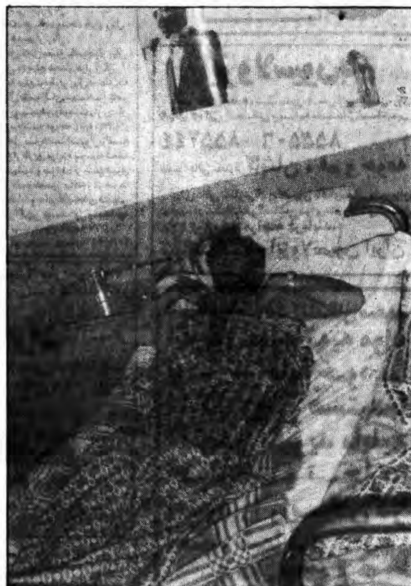
یک مجروح دیگر...