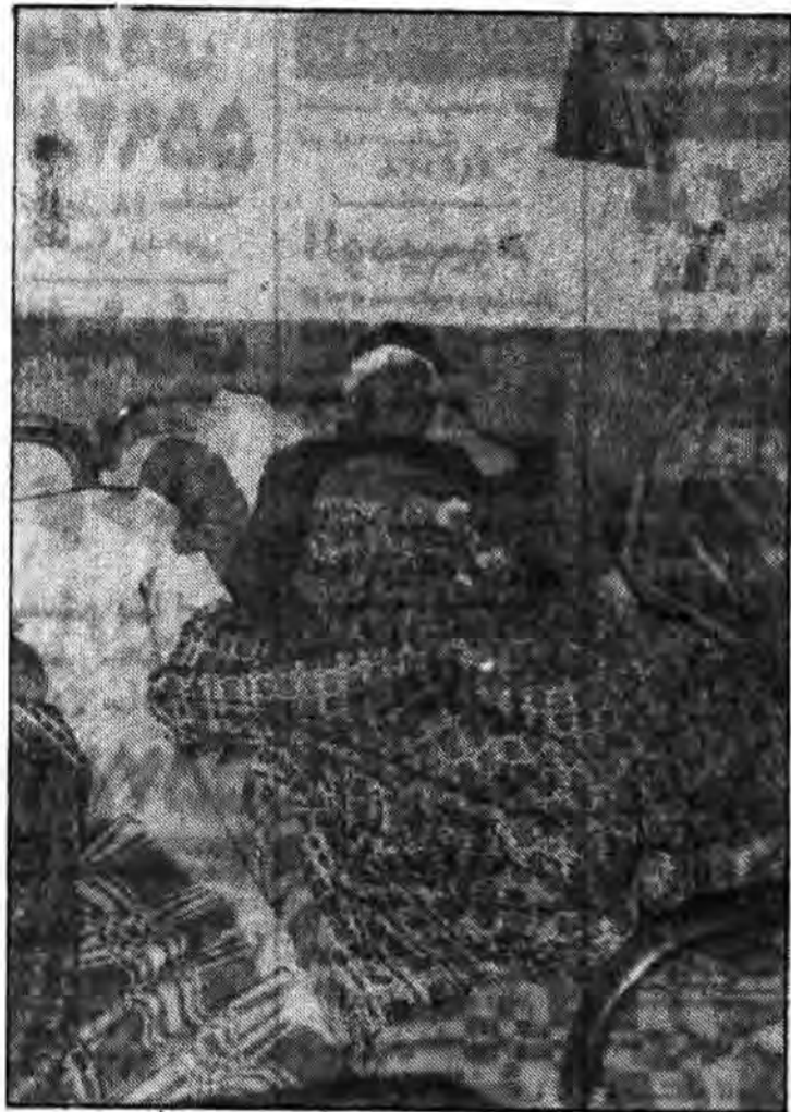
یک مجروح بوسیله مجاهدین خلق مضروب شده است