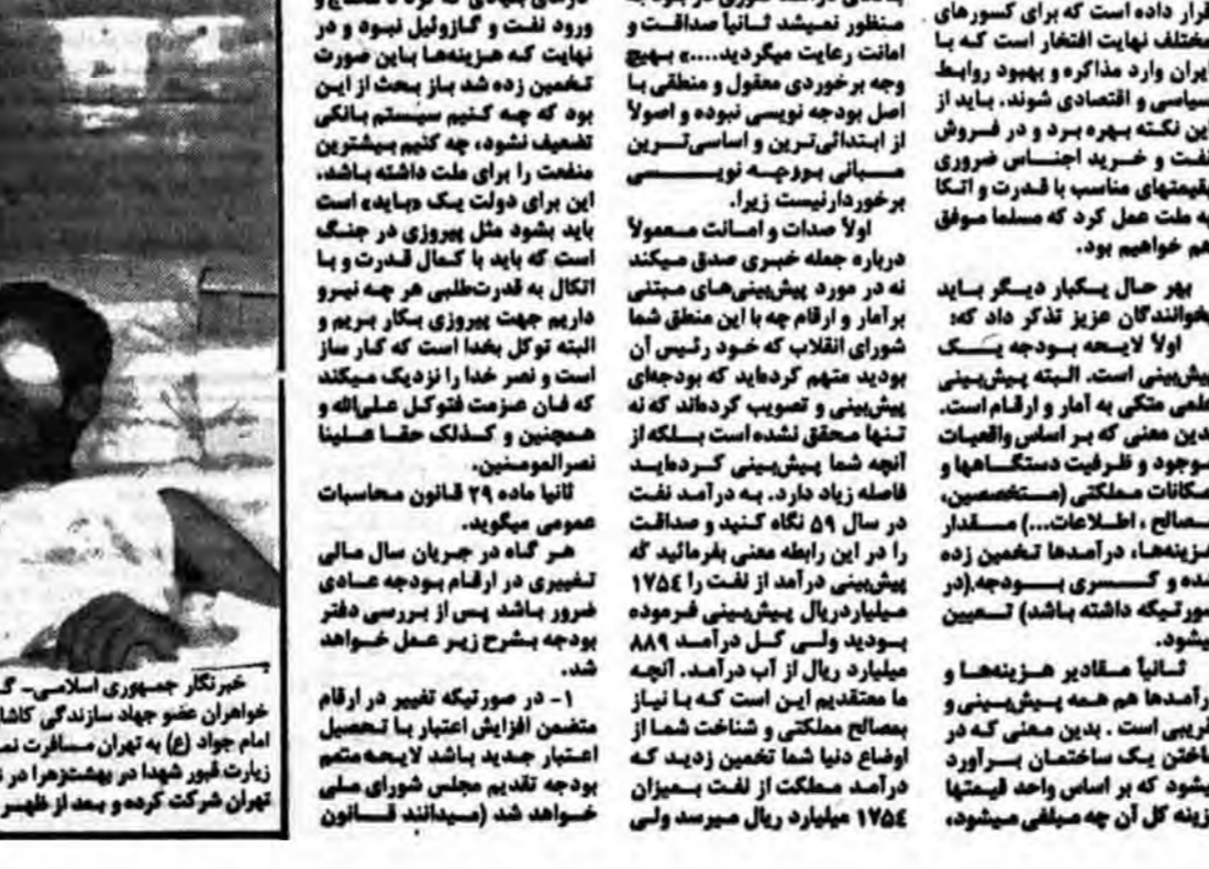
دیدار با معقولین در بیمارستان امام خمینی... دیدار با معقولین در بیمارستان امام خمینی...