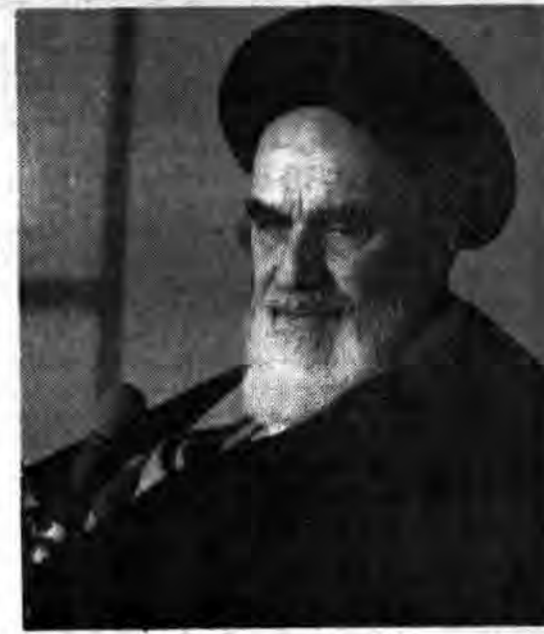
گروهی از روحانیون منطقه بختیاری شهرستان ایده و بانوان اعضاء جهاد دانشگاهی استان پیش از ظهر دیروز با امام امت دیدار کردند.

پیش از ظهر دیروز گروهی از روحانیون منطقه بختیاری شهرستان ایده و بانوان اعضاء جهاد دانشگاهی استان پیش از ظهر دیروز با امام امت دیدار کردند.