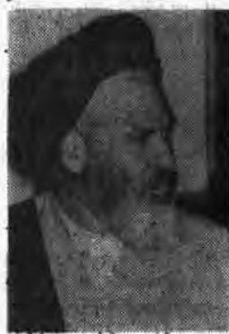
از استاد جلال‌الدین فارسی