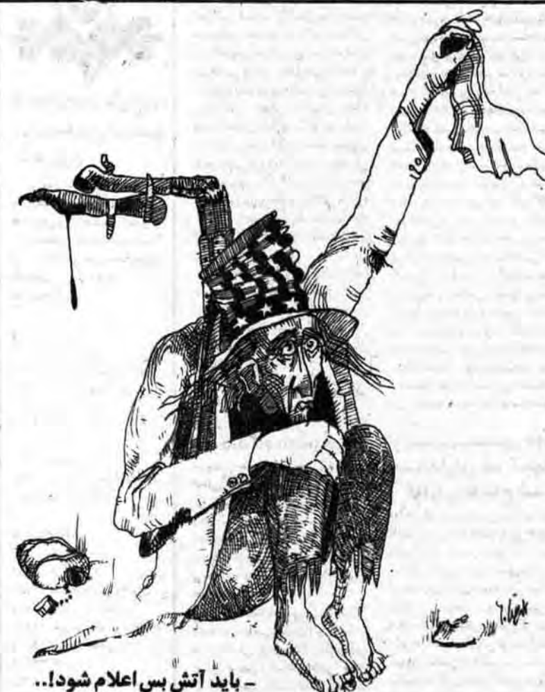
باید آتش بس اعلام شود...

امام خمینی رهبر انقلاب و بنیانگذار جمهوری اسلامی ایران بمناسبت گشایش اولین مجلس شورای اسلامی پیامی فرستادند ما متن کامل این پیام را بمناسبت اولین سالگرد گشایش مجلس شورای اسلامی برای بار دیگر از نظر خوانندگان عزیز می‌گردانیم. سپاه الهی الرحمن الرحیم با خواست خداوند تعالی و به برکت و وصیت در روزی بسیار بزرگ مجلس شورای اسلامی افتتاح میشود. روز سیزدهم رجب که روز ولادت با برکت و سعادت بزرگ مرد تاریخ و معجزه دهر امیرالمؤمنین علی بن ابیطالب صلواتالله و سلام علیه، مجلس مقدس شورای اسلامی است که اولین مجلس جمهوری اسلامی است و اولین مجلس است که با انتخابات آزاد انجام گرفت گشایش می‌یابد و من امیدوارم که این مجلس به برکت این روز مبارک مجلس عدالت و پرهیز اسلام و بنف مسلمان و کشور اسلامی باشد. سیاسی‌ها و بزرگ را که در مدتی کوتاه صفت ایران موفق شد که اساس جمهوری اسلامی را با آزادی و آرامش