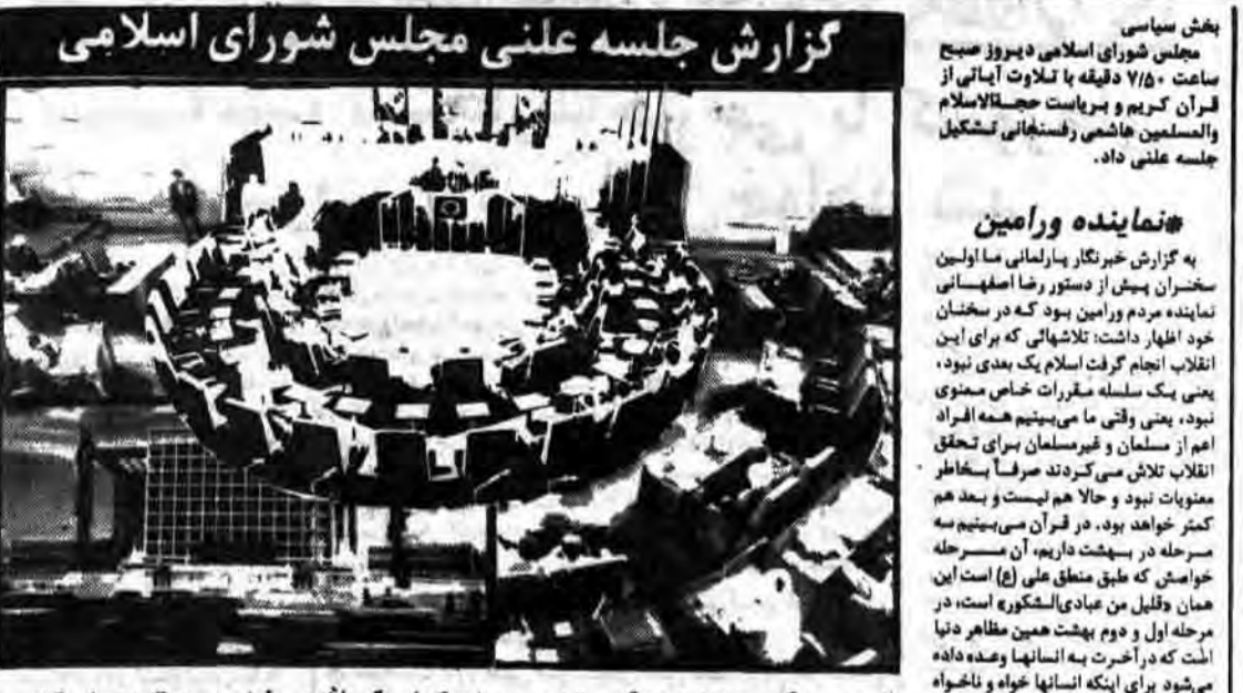
گزارش جلسه علنی مجلس شورای اسلامی